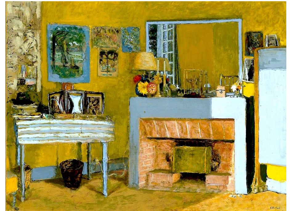
La Chambre de Vuillard au Château des Clayes (c1932) CP