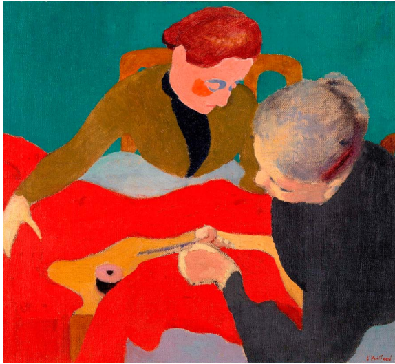
Les Couturières (1890) CP