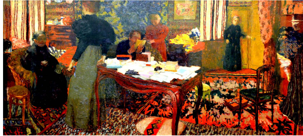
Grand Intérieur aux six Personnages (1896) Kunsthau, Zurich